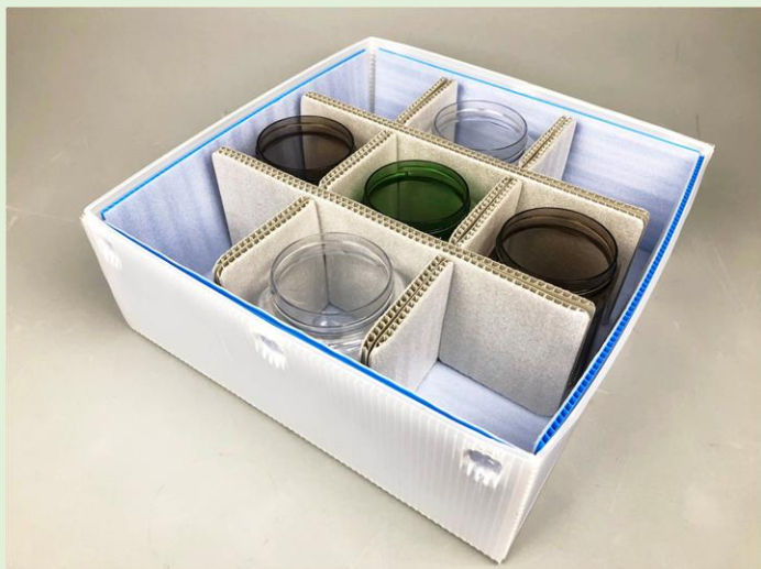
プラダン×ミラーマット

頑丈な木材と安価な段ボールを貼り合わせることで強靱かつ低コストな宙づり梱包を実現します。