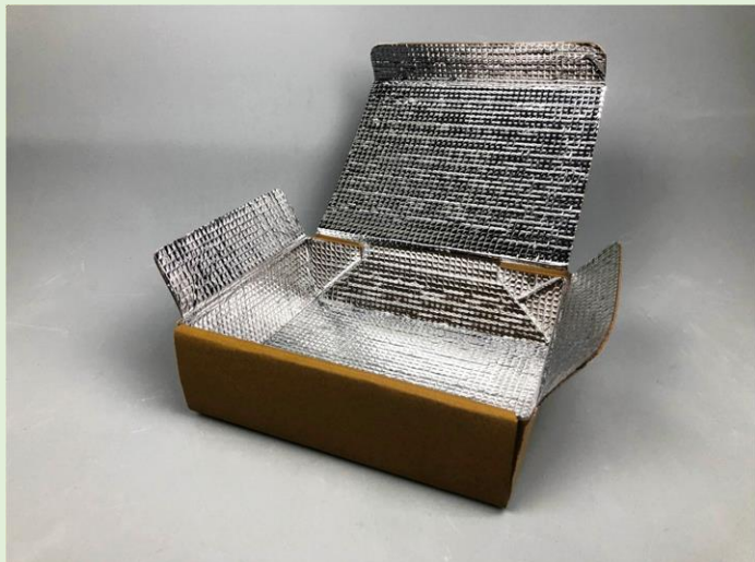
段ボール×アルミ蒸着

段ボールとアルミ蒸着シートの貼り合わせです。保冷状態を保ちながら製品を梱包できます。